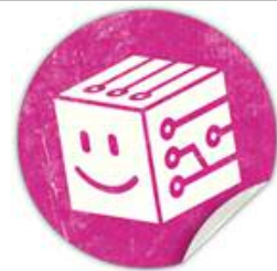
Datamuseet har en ny hemsida.

Datamuseet har numera en alldeles ny hemsida. Sidan byggs på efterhand, men redan nu kan du läsa en del om datorns historia, de utställningar som byggts upp och om pågående aktiviteter. Under hösten anordnar museet bland annat en serie nördcaféer. Läs mer här .