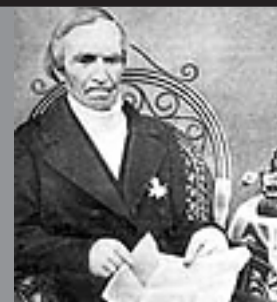
Ydredrottens skrifter finns nu i fulltext på nätet.