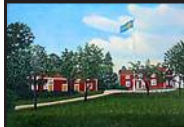
Gården Lilla Gusum i Ringarum.

Det vi ser är en första version av databasen. Den innehåller drygt 100 konstverk som går att söka genom en fritextsökning. Östergötlands arkivförbund arbetar vidare med databasen och kommer att bygga på med fler målningar, precisera uppgifterna kring objekten och förbättra layouten. Läs mer här .