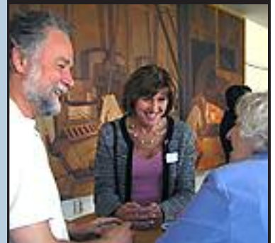
Nästa Kulturarvsdag är i Linköping.

Denna gång kan vi bland annat bjuda på föreläsningar om gåramålningar på nätet, datamuseet och en hembygdsförenings arbete med projektet "Hus med historia". Dessutom får vi veta mer om Nättidningen "Svensk historia", arkeologiskt arbete i Linköping och en hel massa annat. Läs mer här .