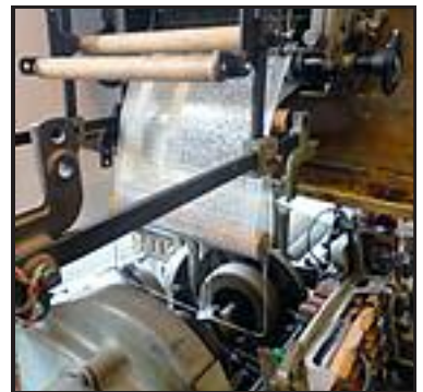
Vävstolen Rüti är första "Månadens ljud".

Vi har nu också startat en serie som vi kallar "Månadens ljud" där vi planerar att lägga ut exempel på ljud tillsammans med en liten berättelse om historien kring ljudet några gånger om året. Först ut är vävstolen Rüti som finns att beskåda på Norrköpings stadsmuseum. Textilindustrin var länge Norrköpings ryggrad och under storhetstiden stod hundratals vävstolar och dunkade i vävsalarna. Det var främst kvinnor som arbetade i denna miljö och förmodligen var det många av dem som fick nedsatt hörsel av oväsendet. Lyssna och läs här .