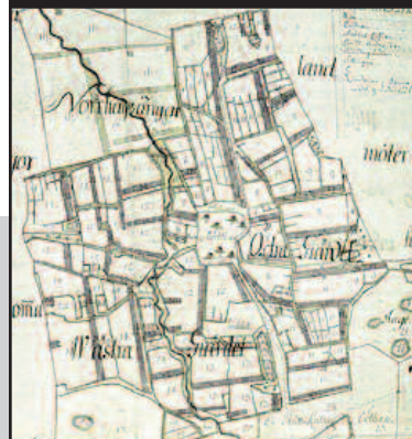
En karta över Mörtlösa by, 1692.

I samverkan med bland annat Kulturarv Östergötland har en speciell ingång gjorts mot det lokalhistoriska materialet. Här kan besökarna till biblioteksportalen nå Kulturarv Östergötlands material, men också hitta en behändig databas där det via en samsökning mellan länets tretton kommunbibliotek går att söka litteratur om den socken man vill veta mer om. Läs mer här .