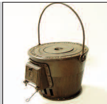
Ett av föremålen i Östra Ryds hembygdsförening.

I Östra Ryd har man samarbetat med KulturArkiv i Söderköping om en alldeles ny hemsida. Här har föreningen och KulturArkiv inventerat och fotograferat hela föremålssamlingen. Detta har resulterat i en databas som gör det lätt för föreningen att hålla koll på sina föremål. Delar av föremålssamlingen går också att se via den nya hemsidan. Läs mer här .