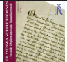
Riksarkivet har lagt ut en databas med de svenska medeltidsbreven.