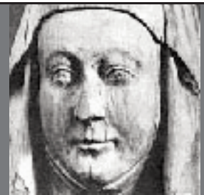
"Den porträttlika Birgitta", Vadstena klosterkyrka.

En nyhet är att bilder från projekten Produkt och bild, Mjölby, Produkt och bild, Finspång och Mångfald i bild fasas in i den gemensamma bilddatabasen. Det betyder att de tre fristående bilddatabaserna har släckts ned och att man från och med nu kan finna bilderna tillsammans med övriga östgötabilder i databasen. Läs mer här .