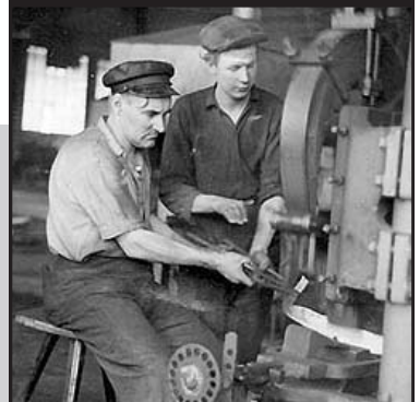
Bild från Igelfors bruk, 1948.