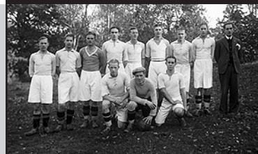
Waldemarsviks IF, 1932.

Arbetet med regionala och kommunala kulturarvsplaner fortsätter. En regional kulturarvsplan, kopplad till den regionala kulturplanen arbetas fram i länet just nu. I slutet av maj kommer kommunala företrädare för kultursektorn att träffas på Östsam för att diskutera arbetet med motsvarigheterna ute i kommunerna