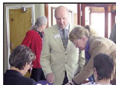
Deltagarna på Kulturarvsdagen strömmar in till museet.