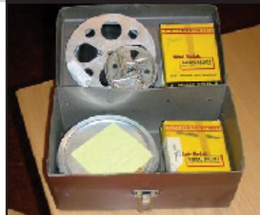
Några exempel ur vår östgötska filmskatt.

De flesta inventerade filmerna finns bara som rullfilm än så länge och dyker på hemsidan upp som inventerade filmkort. Denna pågående inventering gör att vi nu kan bilda oss en uppfattning om filmomfånget på ett helt annat sätt än tidigare. Efterhand får vi också tillgång till digitaliserad östgötafilm. I de fallen kan vi jobba med filmsnuttar på nätet och också börja bygga upp en digital filmbank i länet. Läs mer här .