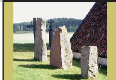
Runstenar vid Ekeby, Boxholm.