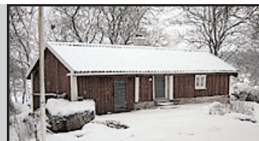
Hembygdsgården Berget i Östra Tollstad. Föreningen har lagt ut sin torpinventering på nätet.

Den nationella arkivdatabasen – NAD – finns ute på Internet i en ny förbättrad version. I utgångsläget domineras NAD fortfarande av information från Riksarkivet, Krigsarkivet och landsarkiven, men information från andra arkiv läggs också in efterhand. Läs mer här .