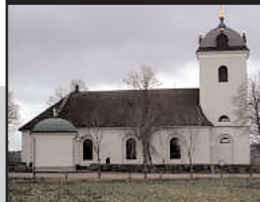
Tåby kyrka, 2006.

Vi kan också nämna att även Östergötland har tilldelats så kallade accesspengar. Dessa ska i första hand användas för tillgängliggörande av kulturarvsmaterial. Vi återkommer med mer information om denna spännande satsning längre fram.