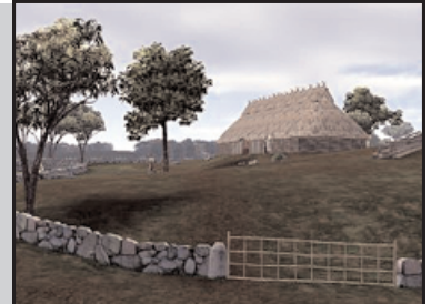
Digital rekonstruktion av en forntida boplats. Bild: Tindraprojektet

Tindraområdet (eller Tinneröområdet som det heter nu) växer fram ur historien med hjälp av modern datateknik. Projektet framställer en virtuell rekonstruktion av landskapet, som ger användaren möjlighet att förflytta sig i tiden och se hur området har förändrats från forntid fram till 1900-tal. Dessutom kommer man att kunna besöka virtuella rekonstruktioner av byar och gårdar från äldre järnåldern fram till mitten av 1800-talet. Bakom projektet, som ska vara klart i höst, står bland annat Linköpings universitet och Garnisonsmuseet. Läs mer här .