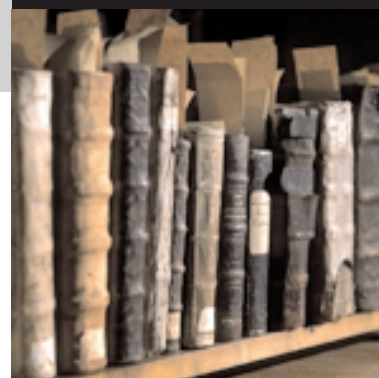
I läns museets forskarmiljö, Faktahyllan, fortsätter utvecklingsarbetet.