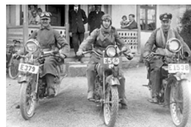
Handlarna i Vikingstad på motorcykelutflykt, ca 1925.

Projektet riktar in sig på nätverksarbete kring emigrationsbrev. I Östergötland utgår vi från den fina samling som finns i Kisa. De 2 200 breven där är numera databasregistrerade och vad vi kan bedöma så står sig samlingen mycket väl även i en europeisk jämförelse.