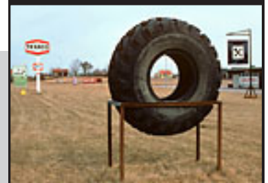
Bensinmack i Ödeshög, 1970-tal.

Kungliga biblioteket (KB) har öppnat en sida på nätet där man kan söka i äldre svenska dagstidningar. Webbtjänsten ger tillgång till hundratusentals sidor tidningstext. Du kan söka på namn och tid, eller bara bläddra i de 24 tidningar som hittills ingår. Fyra av dessa är från Östergötland. Läs mer här .