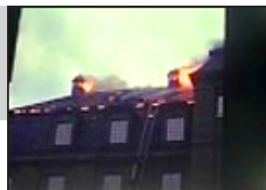
Rådhusbranden 1942 finns på film.