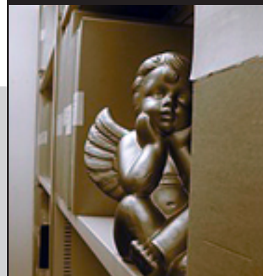
Arkivängeln vaktar föreningsarkivets samlingar.