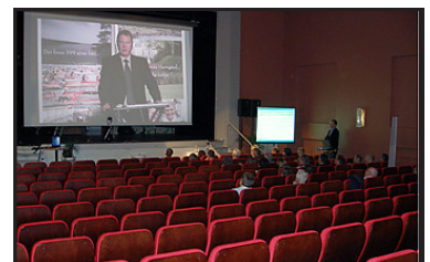
Platsen för vårens Kulturarvsdag är Folkets Hus i Boxholm.

Kanske blir vi lite klokare och framförallt fyllda av ny kraft och nya idéer under dagen. Dessutom fungerar ju Kulturarvsdagarna som en trevlig mötesplats för alla oss som intresserar oss för det östgötska kulturarvet. Och vi är många. Läs mer här .