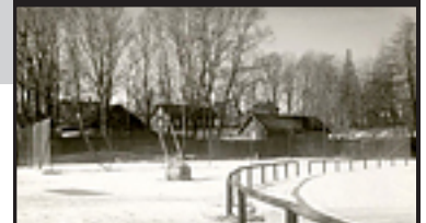
Tennisbanan på Kopparvallen.

Föreningen Brukskultur Åtvidaberg utvecklar sin verksamhet vidare. I den andan har även hemsidan gjorts om rejält. Den nya sidan är mer lättnavigerad och tydlig. Ambitionen är att hålla den aktuell och uppdaterad för att locka nya besökare och återbesökare att titta in igen. En del nya delar såsom "Fråga arkivarien" och "Veckans bild" har tillkommit. Som tidigare är sidan en utmärkt ingång för alla oss som är intresserade av Åtvidabergs historia. Läs mer här .