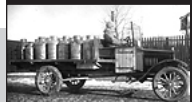
En av många fina bilder på hemsidan om Törnevalla.

Vi brukar lyfta fram hembygd föreningar som har egna hemsidor i våra nyhetsbrev. Vi tar här upp två stycken som har en hel del fint material på sina sidor. Den ena är Törnevalla hembygd förening som lagt ut en ganska omfattande hemsida. Via en imponerande mängd ingångar kan man redan nu ta till sig en hel del material om socknens bebyggelse, företag och samhällsservice genom tiderna. Sidan fylls efterhand på med allt mer innehåll. Läs mer här .