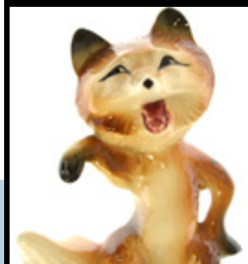
En glad räv från samlingen i Mjölby Porslinsrävmuseum