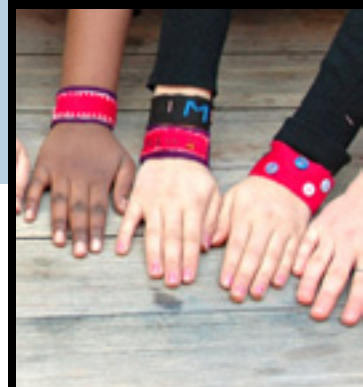
Handarbete avstressande för ungdomar